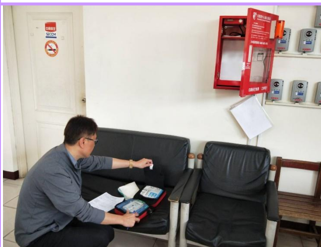
定期相關技師到校檢修