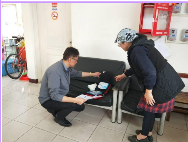
檢修保養後護理師檢視