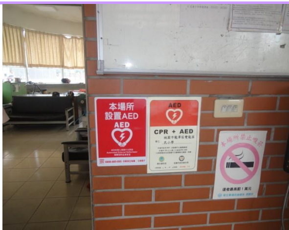
在警衛室外標示相關指示